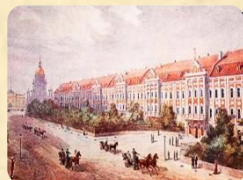
Московский университет, 1848 г.

Изначально он учился на факультете словесности, однако уже через год перевелся в Санкт-Петербург, где получил университетское образование на историко-философском факультете.