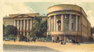
Петербургский университет, 1854 г.

Во время проживания в Петербурге, будущий писатель занимался переводами стихов Шекспира и Байрона.