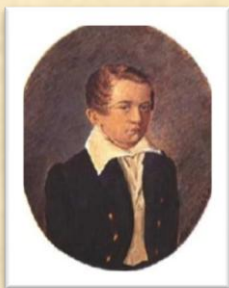
И. С. Тургенев в детстве