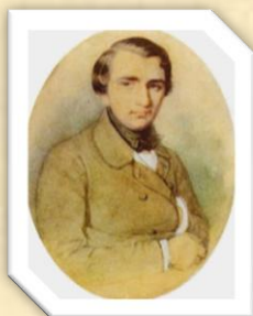
И.С. Тургенев в юности