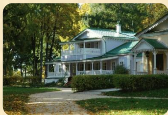
В имени Спасское- Лутовиново прошли детские годы будущего писателя.