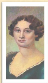
Тургенева (Лутовинова) Варвара Петровна, мать писателя