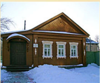
Дом, в котором жили Голиковы в Арзамасе. Сейчас музей.

Родился Аркадий Гайдар (Голиков) в 1904 году в небольшом городе Льгов Курской области. Отец с е д ь с к и й учитель, после О к т я б р ь с к о й революции комиссар штаба 35-й дивизии, мама—учительница, позже фельдшер. У Аркадия было три сестры. В 1912 году их большая семья была вынуждена покинуть свой городок, они переехали в далёкий Нижегородский край в город Арзамас. Здесь Аркадий провёл своё детство, учился в реальном училище и поэтому считал этот город своим родным.