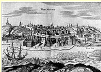
(Нижний Новгород в первой половине XVII века)

Город расположен на месте встречи рек Волги и Оки в центральной части Восточно-европейской равнины, в 400 км на восток от Москвы.