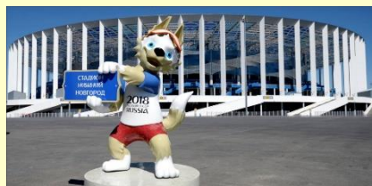
(Новый нижегородский стадион, сооруженный к Чемпионату мира по футболу)

В 2013г. была запущена городская электричка. В 2018г. город стал одним из мест проведения чемпионата мира по футболу.