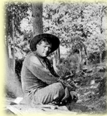
(Джек Лондон в юности)

Джек принялся за написание рассказов, но они оказались никому не нужны. Тогда в 1897 году он отправился на Аляску в поисках золота. Это решение оказалось неудачным: вместо слитков он подхватил цингу, от которой долго не мог избавиться.