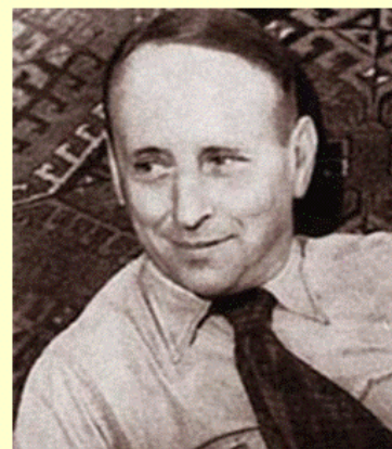
Евгений Львович Шварц

Наш адрес: 607062, Нижегородская область, г. Выкса, м-н Юбилейный, 8. Тел.: 8(831774-36-09 e-mail : bibdeti @yandex.ru Сайт: www.mbukcbs.ru