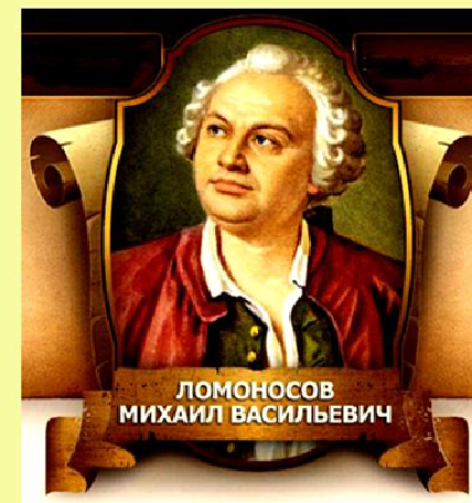
ЛОМОНОСОВ МИХАИЛ ВАСИЛЬЕВИЧ

Информационный буклет к 305 - летию со дня рождения М.В. Ломоносова 1711—1765