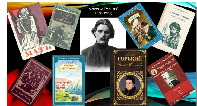
Книги М. Горького

“Книга, быть может, наиболее сложное и великое чудо из всех чудес, сотворенных человечеством на пути к счастью и могуществу будущего.”