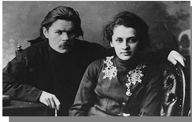
М. Горький с женой Е. Пешковой

Рано лишился отца, провёл детство в доме деда – владельца красильной мастерской. В литературу ему помог войти В.Г. Короленко. В 1892 Горький впервые выступил в печати с рассказом «Макар Чудра». С этого момента начал систематически заниматься литературным трудом. Большой резонанс имел сборник «Очерки и рассказы». Многие произведения писателя становились литературной сенсацией: автобиографический триптих «Детство», «В людях», «Мои университеты».