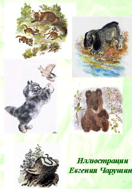
Иллюстрации Евгения Чарушина

Художника, который рисует животных, называют анималист. Чарушин делал иллюстрации к книгам и первой такой была «Мурзик», которую написал Виталий Бианки. Он много рисовал к книгам других писателей, которые рассказывали про животных – это Пришвин, Маршак, Бианки, Ушинский и многие другие. Один из его рисунков попал в Третьяковскую галерею.