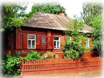
Дом Каширина» (Нижний Новгород)

Родился 16 (28) марта 1868 года в г. Нижний Новгород в небогатой семье столяра. Настоящее имя Максима Горького – Алексей Максимович Пешков. Родители его рано умерли, и маленький Алексей остался жить с дедом – Василием Кашириным.. Наставницей же в литературе стала его бабушка, которая и провела внука в мир народной поэзии. Он написал о ней кратко, но с большой нежностью: «В те годы я был наполнен стихами бабушки, как улей мёдом; кажется, я и думал в формах её стихов».