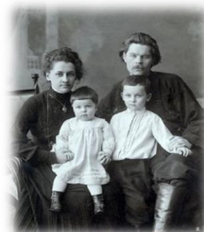
Горький с семьей