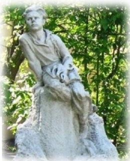
Памятник Алёше Пешкову. 1955—1957 гг. (Нижний Новгород) скульптор А. В. Кикин.