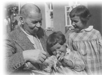
Горький с внуками. 1930 г.